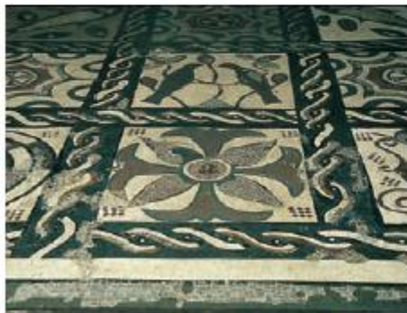
Mosaico romano, siglo IV. Vega del Ciego, Lena.

Observa el mosaico y la interpretación que se ha hecho de una parte con la técnica del collage. Después, realiza una interpretación del mosaico utilizando esa misma técnica.