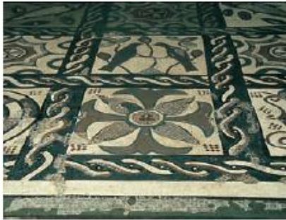
Mosaico romano, siglo IV. Vega del Ciego, Lena.

Observa el mosaico y la interpretación que se ha hecho de una parte con la técnica del collage. Después, realiza una interpretación del mosaico utilizando esa misma técnica.